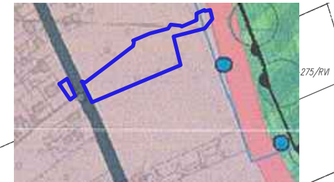
WYRYS ZE STUDIUM UWARUNKOWAŃ I KIERUNKÓW ZAGOSPODAROWANIA PRZESTRZENNEGO GMINY MIASTO PUŁAWY